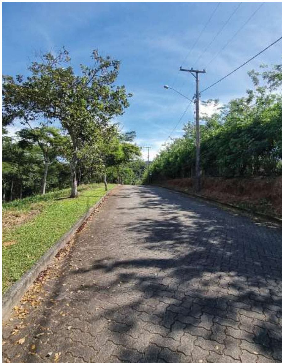
Rua de acesso ao lote.